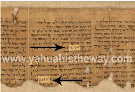
Israel Museum, Jerusalem, The Commentary on Habakkuk